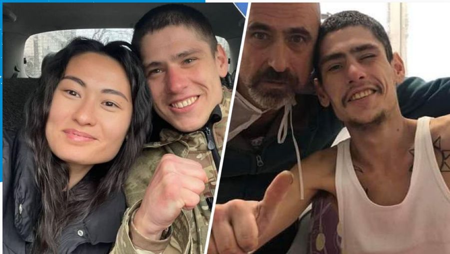
'Het wonder van Oekraïne': militair na 42 dagen gered uit kelder

Een medicijn tegen kanker. Wereldvrede. Geen honger meer of aardbevingen. Je kunt dit rijtje waarschijnlijk moeiteloos aanvullen met nog meer gedroomde situaties. Zullen ze ooit werkelijkheid worden? Je zou zeggen: dat vergt op z'n minst een wonder van genezing, van compleet anders denken of wijzigingen in de opbouw van de aardkorst. 'Moet kunnen,' zegt 60 % van de Nederlanders. Zij geloven in wonderen, al zijn er maar weinig - zo'n 10 % - die een wonder linken aan God (onderzoek Trouw, 21 februari 2020).